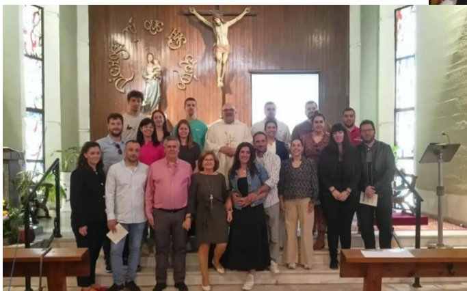
Parroquia Nuestra Señora de La Paz 12 parejas