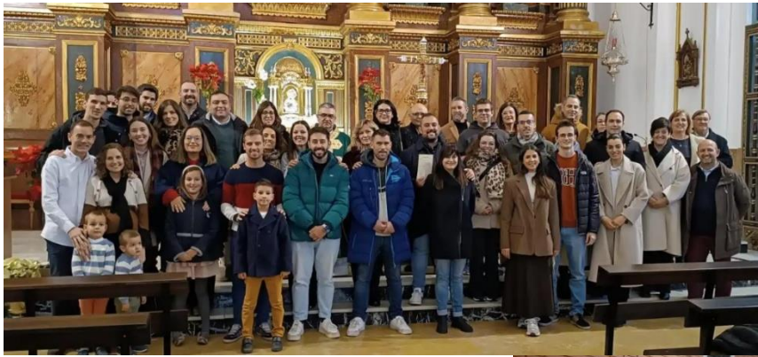
Parroquia de El Salvador