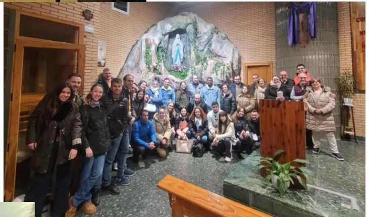
Parroquia de San Fernando 16 parejas